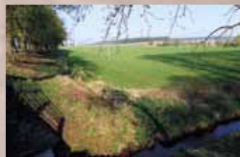
Zde se rozkládala vodní plocha velkého rybníka Podhrázkého mlýna

Citace a údaje v textu jsou čerpány z fondu okresního archivu v Jičíně, státního archivu v Zámruku a veřejně dostupné literatury. Obrazovou dokumentaci k textu tvoří fotografie historické a současné. Dále kopie plánů mlýnů a mapové podklady.