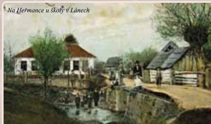
Na Heřmance u školy v Lánech

Tok Heřmanky v obci Lány nebyl regulován. Břehy potoka zpevňovaly kořeny olší. Jen v jednom místě došlo ke změně toku a to po přístavbě školy na dvoutřídní. Školní zahrada leží na závězce původního koryta. Regulací části koryta pod zahradou vzniklo místo pro případné zahrazení toku dřevěnými fošnami a vzednutí vody pro účely požární nádrže. Děti se zde i koupaly a odtud byla brána voda pro školní zahradu. Náladu krásně vystihuje historická kolorovaná fotografie. Je na ní školní budova a pan učitel, patrně oděn ve vojenské uniformě, stojí na pozemku školní zahrady.