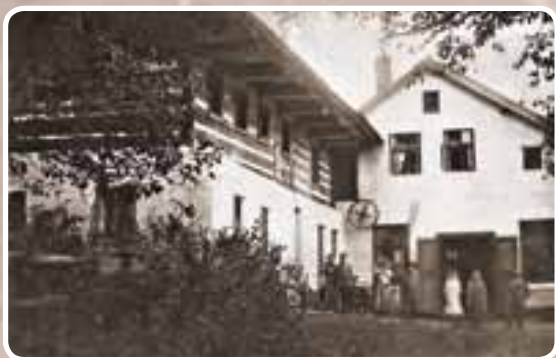
Zezulkův mlýn čp. 14