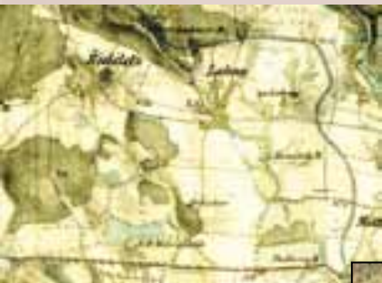
Horáčkův mlýn a mlýn Podhrázký na mapě II. vojenského mapování

Asi dvě stě metrů pod obcí Lány v místě pod původním brodem, kde se Heřmanka prudce stáčí doprava, byla rozlohou nevelká vodní plocha rybníka a pod ním stál mlýn zvaný Horáček. Odkdy zde stál není záznamů, ale mohlo to být ke konci 17. století. Na mapě I. vojenského mapování z roku 1764 jsou vyznačeny dva rybníky. Na mapě II. vojenského mapování z roku 1836 - 1852 jsou zakresleny oba mlýny, Horáčkův a Podhrázký.