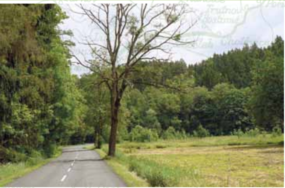
Zde u Bělé měl úzké údolí překlenout železniční most.

Je tomu již více jak devadesát let, kdy se našim krajem začala šířit zvěst o chystané stavbě dráhy z Jičína do Chotěvic u Trutnova přes Novou Paku a Peckku. Abychom však plně pochopili snahy tehdejších interesentů, tedy zájemců o realizaci drážního projektu převážně z řad jičínských občanů, musíme se přenést téměř o 170 let proti proudu času.