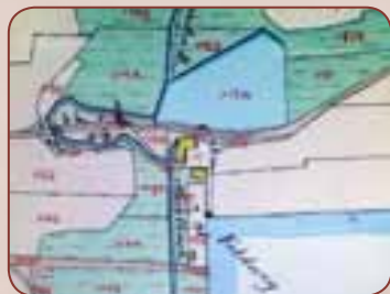
U Horáčkova mlýna